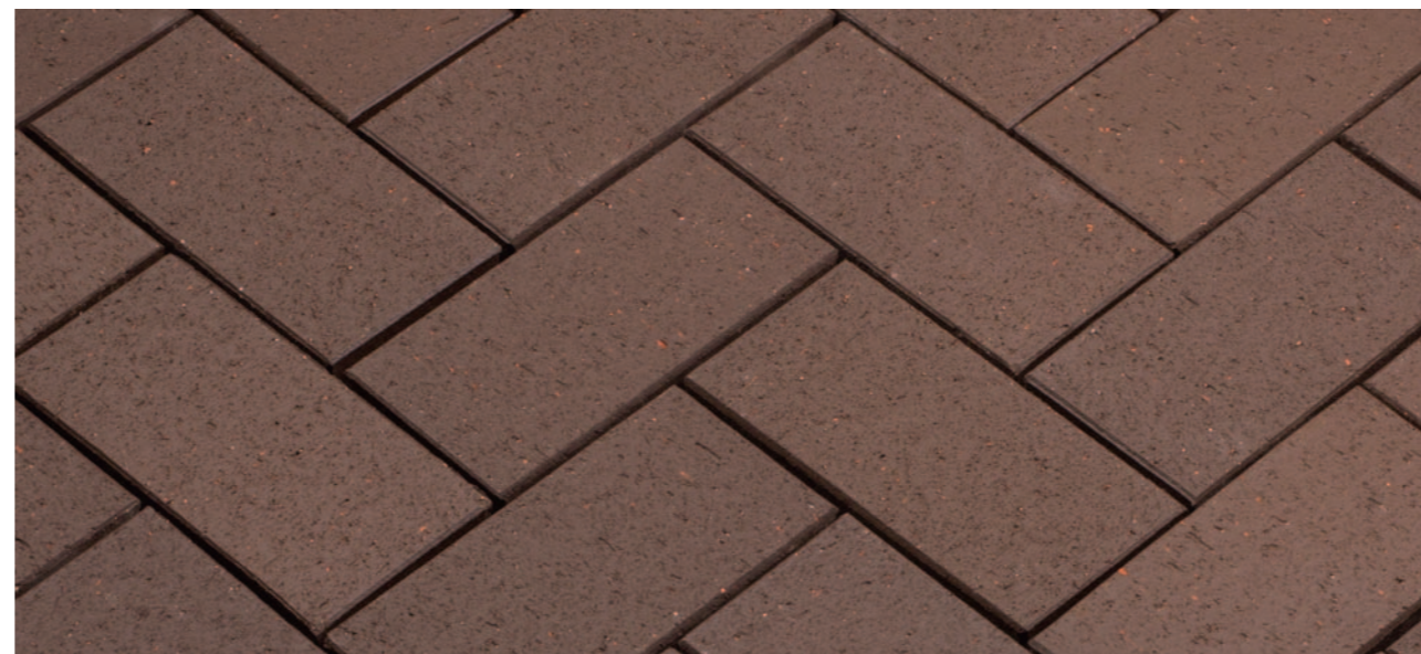
Baltic Braun – Коричневый