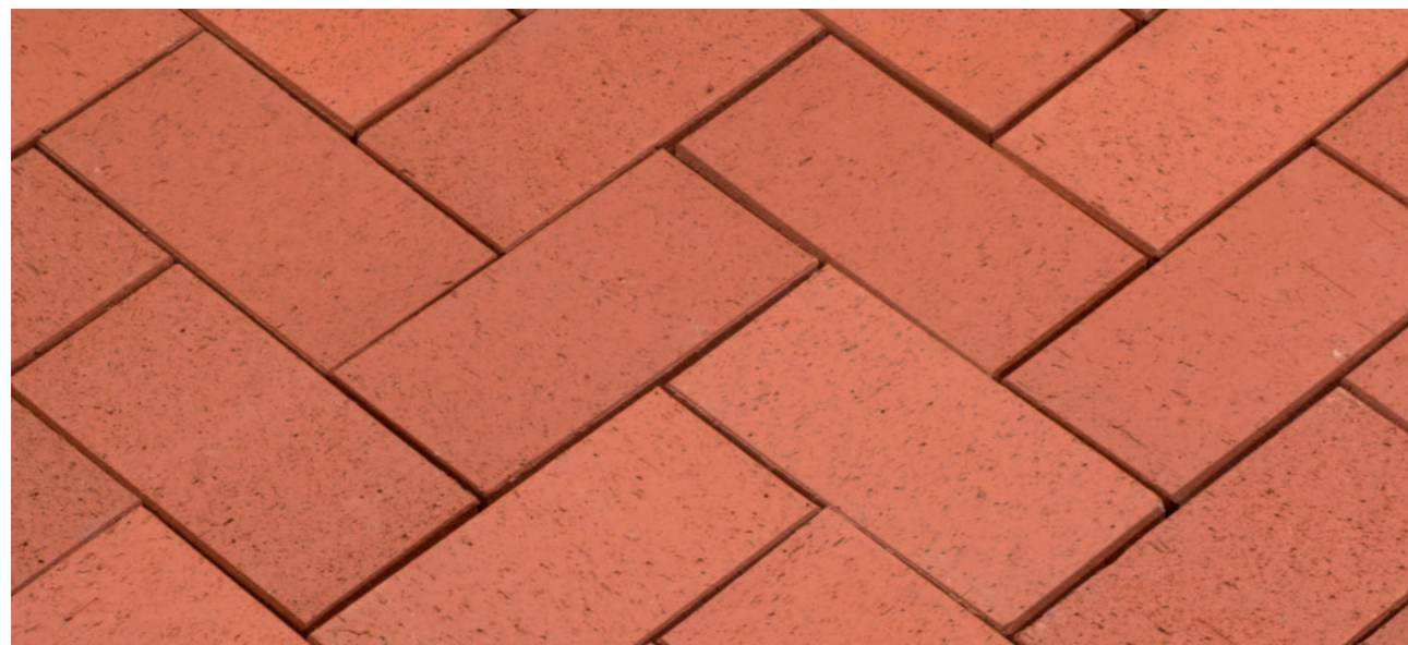
Baltic Classic – Красный