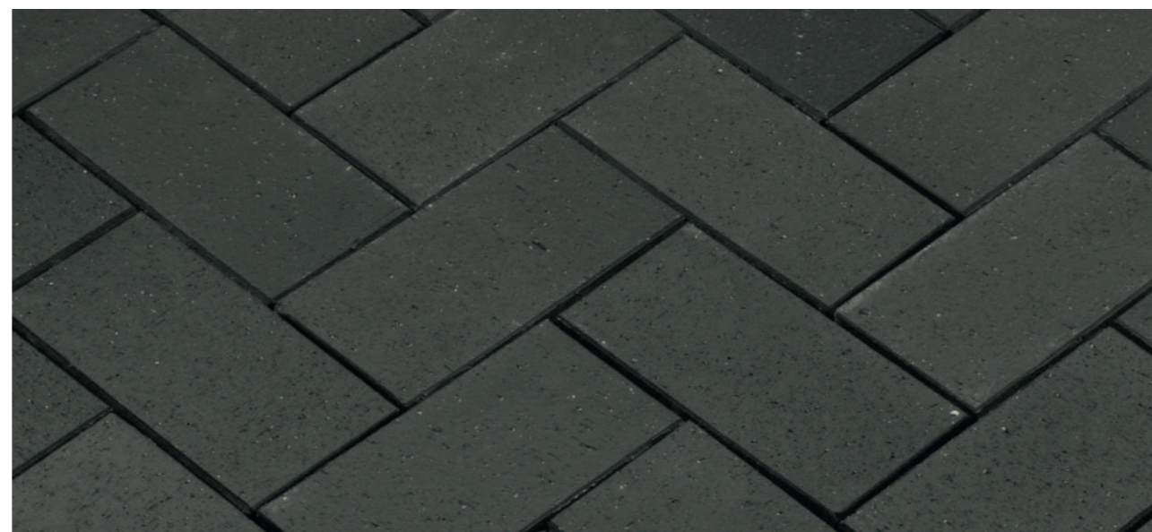
Baltic Grafit – Черный